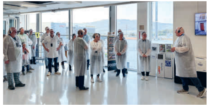
Hygiene ist das A und O: Vor dem Rundgang durch die Coop Bäckerei in Schafisheim mussten die Gäste Schutzkleidung anziehen.