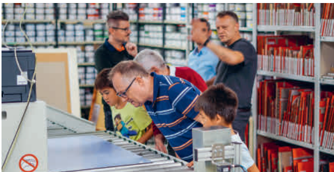
Auch für die jüngeren Gäste spannend: Das hochmoderne Druckunternehmen Kromer Print in Lenzburg.