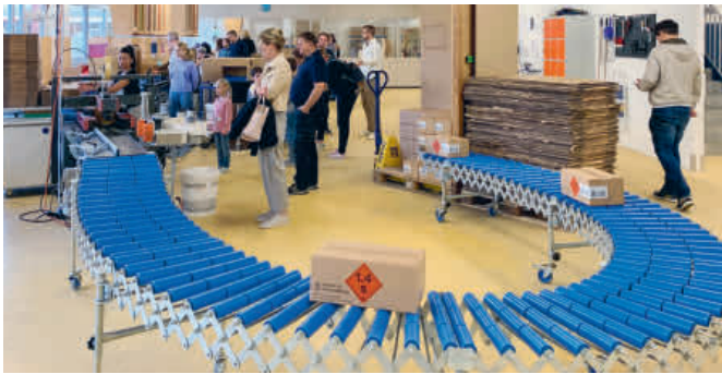
Der Rundgang bei Constri in der europaweit einzigen Tischbombenproduktion in Schinznach-Dorf begeisterte Jung und Alt.