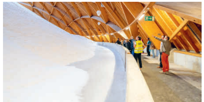
Die Holzkuppelbauten der Saline Riburg beheimaten riesige Mengen Auftausalz für die Schweizer Strassen.