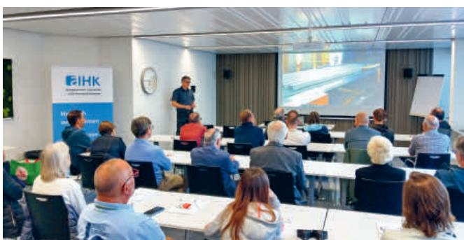
Das Team der Montana Bausysteme ist mit Leidenschaft am Werk.

Alu Menziken Extrusion lockte bereits zum zweiten Mal zahlreiche Gäste in ihre Metallverarbeitungshallen.