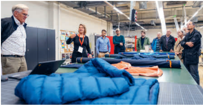
Im Aargauer Seetal werden die hochwertigen Outdoor-Produkte am Hauptsitz von Mammut entwickelt.

«Uns hat es viel Freude bereitet, die kleinen und grossen Gäste an der Nacht der Aargauer Wirtschaft durch unsere Produktion zu führen und sie mit unserer Leidenschaft für Tischbomben anzustecken.»